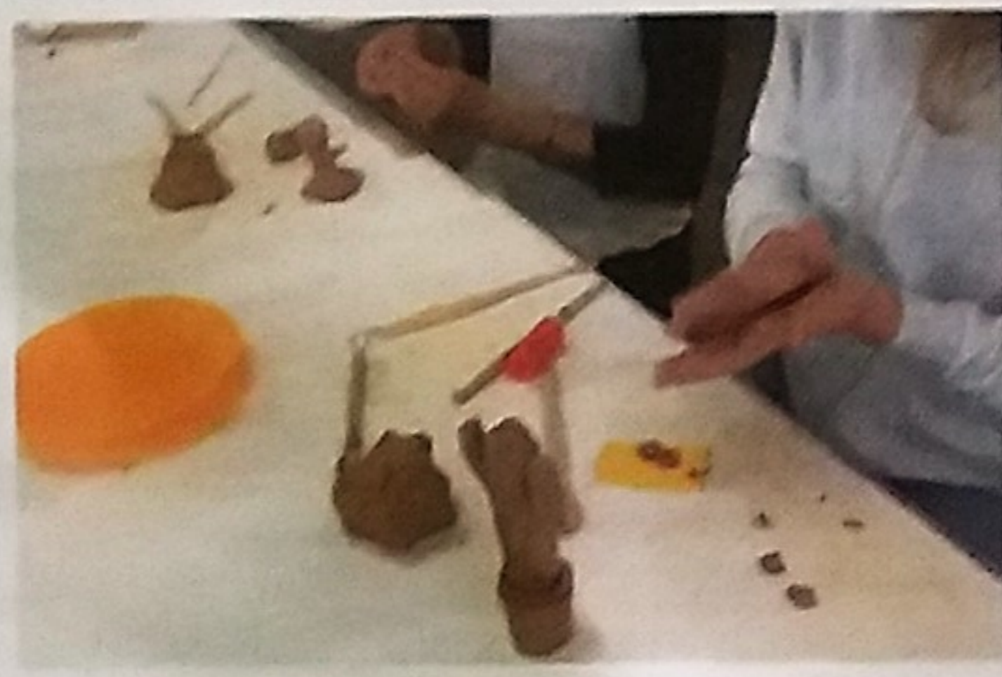
Plastisches Gestalten mit Ton