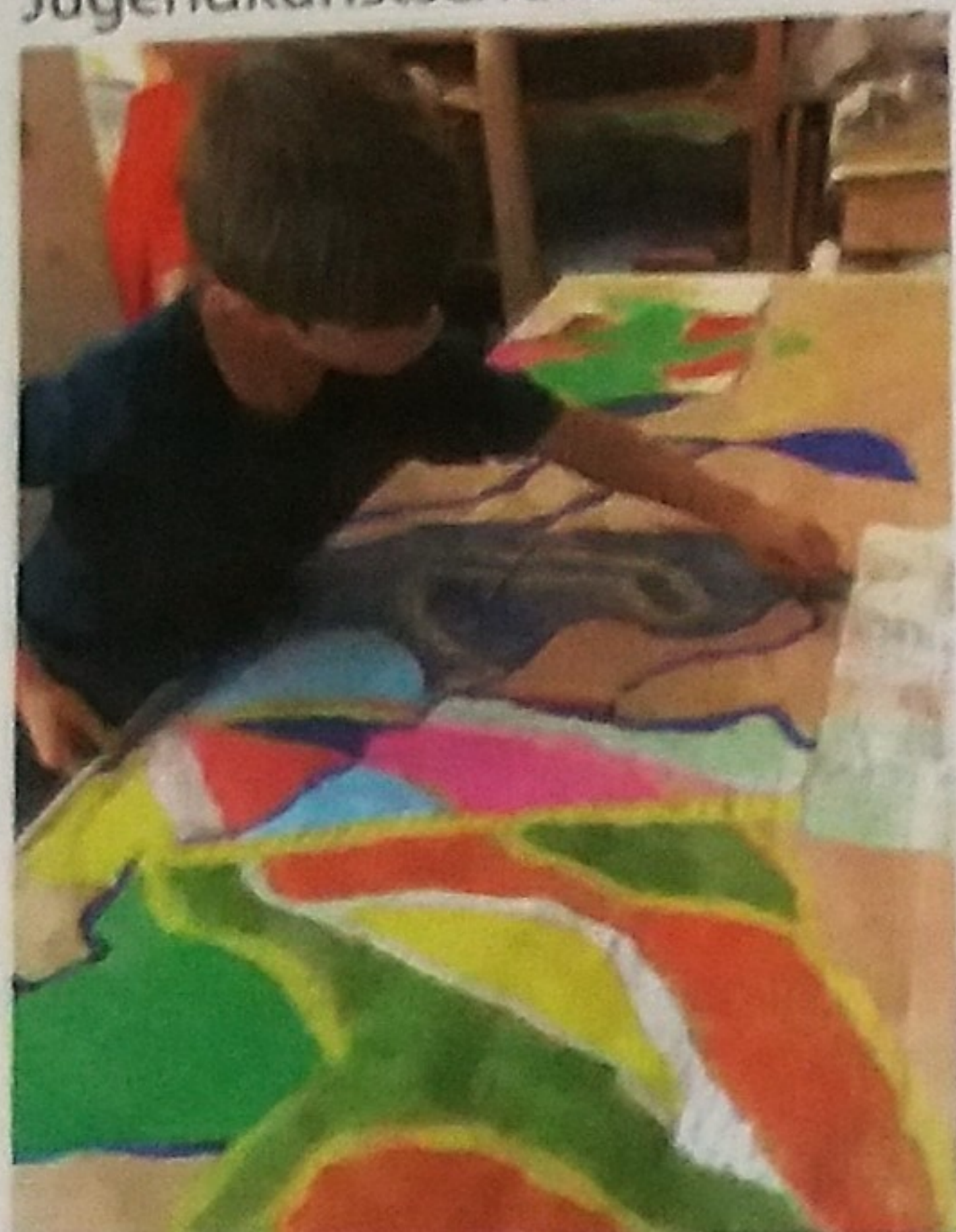
Malen mit Stiften und flüssigen Farben auf großen Formaten

Jeden Donnerstag und Freitagnachmittag werden Kinder im Alter von 8 bis 13 Jahren im Atelier der Jugendkunstschule in Dossenheim zu kleinen Künstlern. Sie malen und zeichnen mit unterschiedlichen Farben, Stiften, Kreiden und Tuschen, gestalten mit Ton, Gips, Holz und Naturmaterialien aller Art und Drucken an der Druckerpresse im Atelier. Nachmittags stehen der Jugendkunstschule das Atelier und der Garten zur Verfügung.